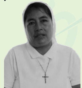
Hermana Aurora de María Parroquia - Misión de Netia